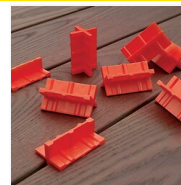
Espaceurs de lames Deck Spacer