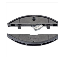
Assembleur P-System Clamex P-14