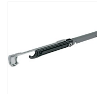
Amortisseur SAF Slim et Evolution