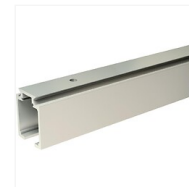
Rail SAF Evolution pour porte bois