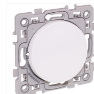
Interrupteur va-et-vient Aurigny 2