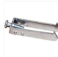
Griffe pour cadre d'appareillage Aurigny 2