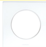
Plaque Aurigny 2