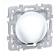
Sortie de câble Aurigny 2