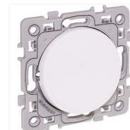
Interrupteur va-et-vient Aurigny 2