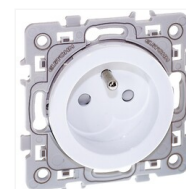
Prise de courant fort Aurigny 2