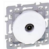
Prise TV Aurigny 2