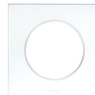
Plaque Aurigny 2