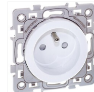
Prise de courant fort Aurigny 2