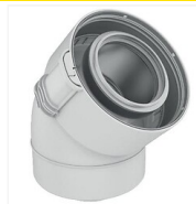
Jeu de 2 coudes PPTL/PP Rolux Condensation Sékurit 45°