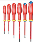
Jeu de 6 tournevis isolés VDE 1000V Protwist - ATDVE..J6