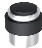
Butoirs de sol aluminium Bagaud