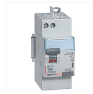
Interrupteur différentiel DX 3 bipolaire