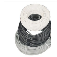
Câble rigide R2V