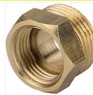
Mamelon laiton M/F réduit femelle