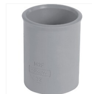
Manchon PVC F/F