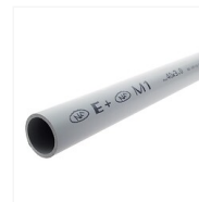
Tube d'évacuation PVC gris NF 4,00 M