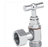
Robinet d'arrêt équerre chromé