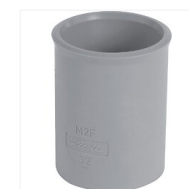
Manchon PVC F/F