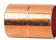
Manchon cuivre égal F/F à souder 270CU