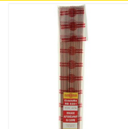
Baguettes brasure cuivre auto-décapante RB 5281