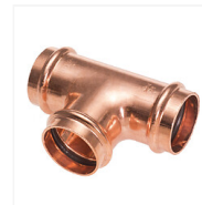
Té cuivre égal Press FFF à sertir