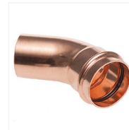
Coude cuivre Press 45° M/F à sertir