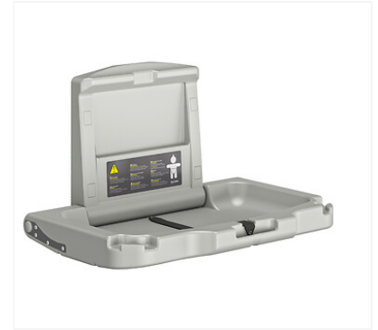
Table à langer murale. Avec sangle ajustable pour parfaitement s'adapter à la morphologie du bébé changé. Pour un enfant jusqu'à 11kg ou 12 mois. Polyéthylène à haute résistance (HDPE). Encombrement minimum : retenue en position verticale. Descente freinée. Entretien facilité : surface facile à nettoyer. Conforme aux normes EN 12221. Dimensions : format ouvert 855 x 495 mm, format fermé 855 x 585 x 107 mm. Poids de la table à langer : 11,5 kg.