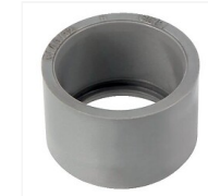
Réduction PVC incorporée M/F