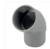
Coude PVC 45° M/F