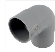
Coude PVC 87°30 M/F