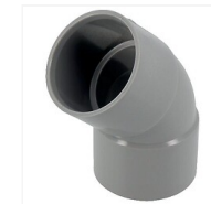
Coude PVC 45° F/F