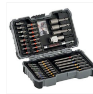
Coffret de 43 embouts de vissage