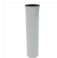
Conduit Twinsafe PP (polypropylène)