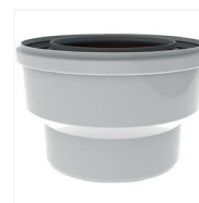
Adaptateur Twinsafe PP (polypropylène)