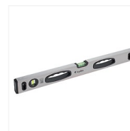
Niveaux à poignée Loyauté II