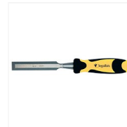
Ciseaux à bois COSTANS II