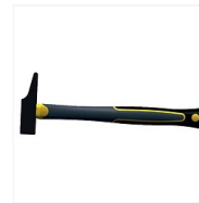
Marteau menuisier Taureau II