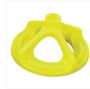
Tête à visser SIBALD