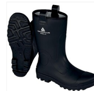
Bottes Nickel S5 CI SRC en PVC fourrées