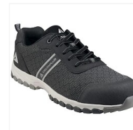
Chaussures basses Boston S1P HRO SRC