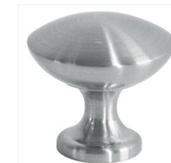
Boutons plats Bendor