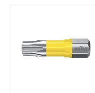
Embouts empreinte Torx Y