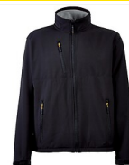
Vestes Softshell Perrot