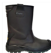
Bottes cuir BARTHELASSE S3 CI SRC