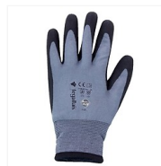
Gants BANNEC hiver