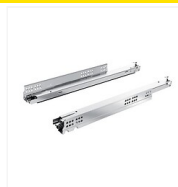
Coulisse Actro 5D pour tiroir bois avec amortissement Silent System - charge 40 kg