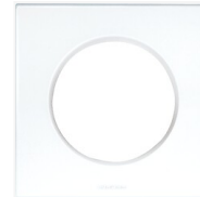
Plaque Aurigny 2