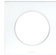
Plaque Aurigny 2