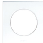
Plaque Aurigny 2