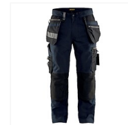
Pantalon artisan stretch 1590