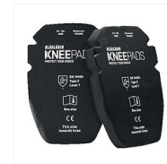
Genouillères Gel - 403