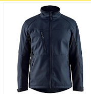
Veste Softshell 4950