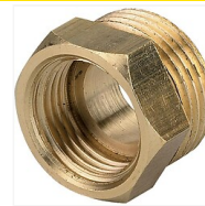
Mamelon laiton M/F réduit femelle