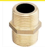
Mamelon laiton égal M/M à visser