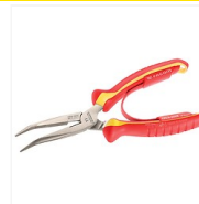
Pince à bec demi rond coudé VDE 1000V - 195A.VE