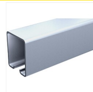
Rails pour ferrures Sportub - Force 80 kg par battant