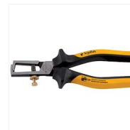
Pince à dénuder ajustable Puka Puka