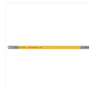
Lames de scies à métaux HSS bimétal Tiga II