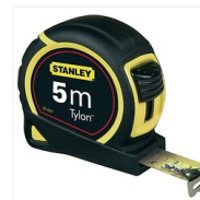
Mesures roulantes courtes boîtier bi-matière Tylon