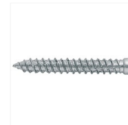
Vis de montage de chassis vitrés tête cylindrique Torx Ar-Mobic II acier zingué blanc entièrement filetés