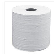
Bobine ouate blanche Hoëdic