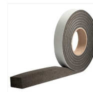
Bandes d'étanchéité adhésives 1 face pour menuiseries Bali