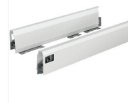
Profils hauteur 94 mm - blanc