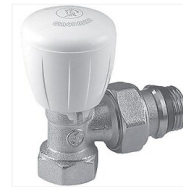
Robinet équerre thermostatique R421TG