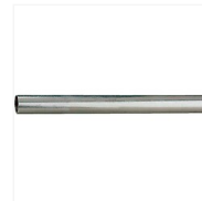
Canne chromée R194