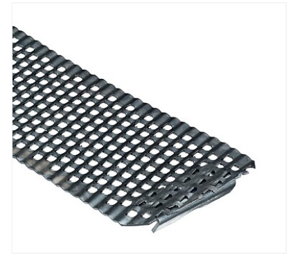
Plate fine. Pour rabot bloc. Pour tous travaux de finition sur bois