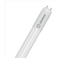
Tube LED T8 SubstiTube Value