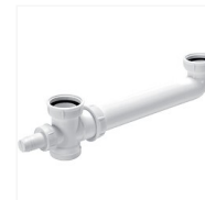
Tubulure de raccordement pour évier 2 cuves