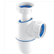
Siphon évier Easyphon