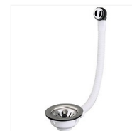
Bonde évier à panier manuel Ø 114 avec trop plein