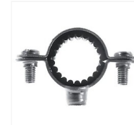
Colliers simples isophoniques acier zingué pour tuyaux et tubes