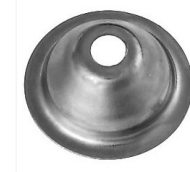
Rosaces d'écartement conique acier zingué