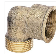
Coude laiton 90° M/F à visser