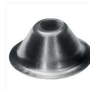
Rosaces d'écartement acier zingué RAMUSSEN