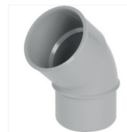
Coude PVC 45° M/F