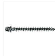
Pattes à vis bois acier zingué RAMUSSEN