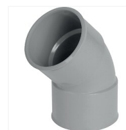
Coude PVC 45° F/F