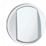
Enjoliveur ou doigt pour va-et- vient et poussoir large