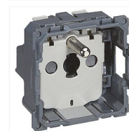
Prise de courant fort Céliane