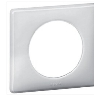
Plaque Laqué Céliane