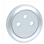
Enjoliveur Céliane pour prise de courant fort