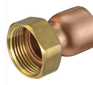
Raccord 2 pièces droit à visser femelle/douille cuivre à souder 359 CGU