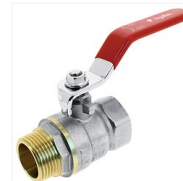
Vanne boisseau sphérique Vagar Mâle/Femelle à manette – PN32