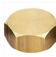
Bouchon laiton femelle à visser