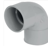
Coude PVC 87° 30 F/F