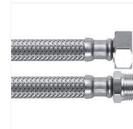
Flexible inox alimentation sanitaire M/F Gargalo