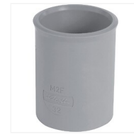
Manchon PVC F/F