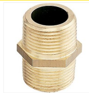
Mamelon laiton égal M/M à visser