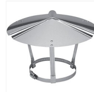
Chapeau chinois Inox