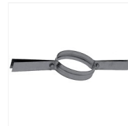
Collier de tubage inox