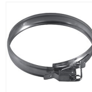
Collier de sécurité inox