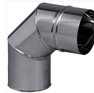
Coude ouvert à 3 parties lisses 90°